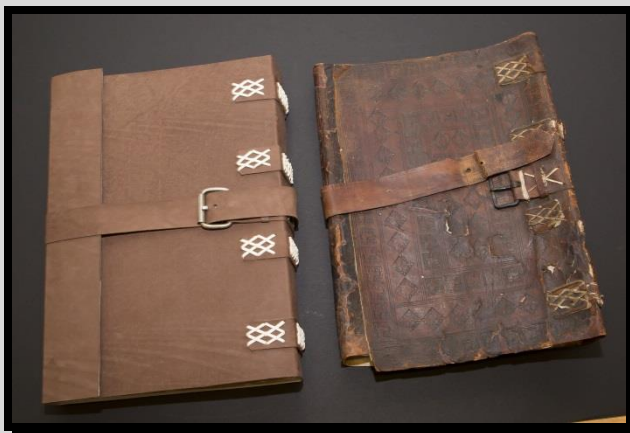
Hauptbuch des Beginenhauses vor und nach der Restaurierung

Das Schriftgut ist von Mikroben oder Tintenfraß befallen, Akten enthalten säurehaltiges brüchiges Papier, Buchrücken und Aktendeckel sind eingerissen oder haben sich ganz abgelöst. Nur eine professionelle Restaurierung kann die Einflüsse der Zeit stoppen.