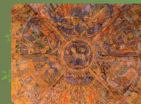
Stifter und Bechtelohr