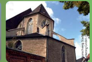
Braunschweig Stadtmarketing GmbH / Taylor