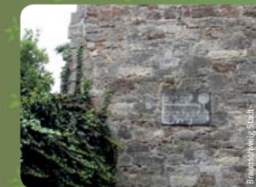
Braunschweig Stadtmarketing GmbH / Taylor