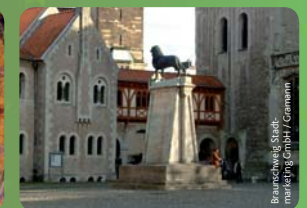
Braunschweig Stadtmarketing GmbH / Gramann