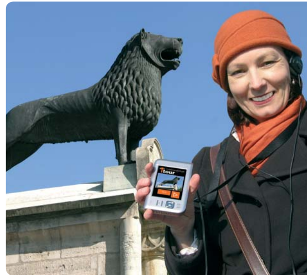
Tour city guide GmbH

Gunzelin von Wolfenbüttel was Emperor Otto's steward – the highest ranking one responsible for provisions and the running of the court. He is the historical figure that guides you through the medieval Braunschweig on this audio guided tour. This electronic guide can be used during the whole year and describes the most important medieval sights with the help of audio plays and pictures on a route that you can decide on yourself.