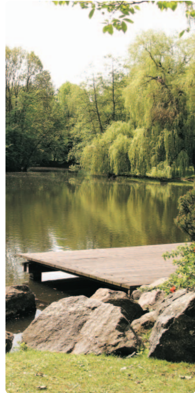
oben: Südteich links: Plan von 1892