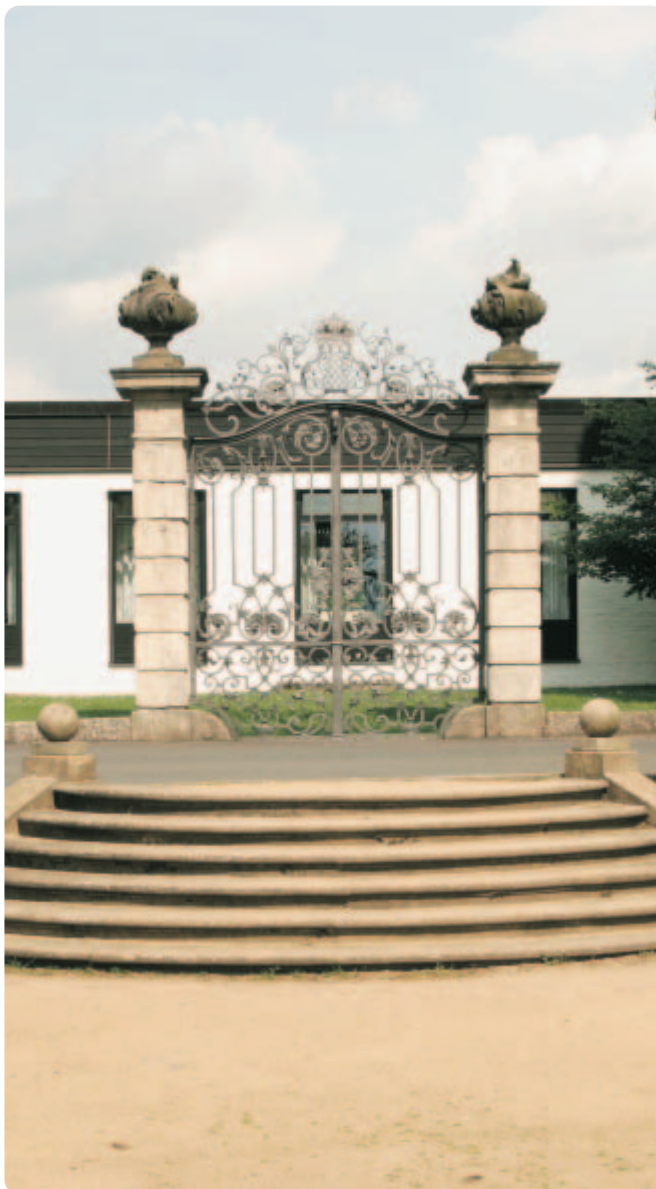
rechts: Eingangstor am BTHC