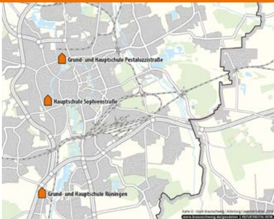
نموداری از مدرسه های هایت

در این مدرسه دانش آموزان اطلاعات و دانش عمومی به دست می آورند. این امکان به آن ها داده می شود که راه فردی و کاری خود را پیدا کنند. درس ها به شکلی طرح ریزی شده است تا هر دانش آموز خود را با واقعیت های منطبق بر زندگی واقعی و شرایط و خواست های کاری تطبیق بدهد.