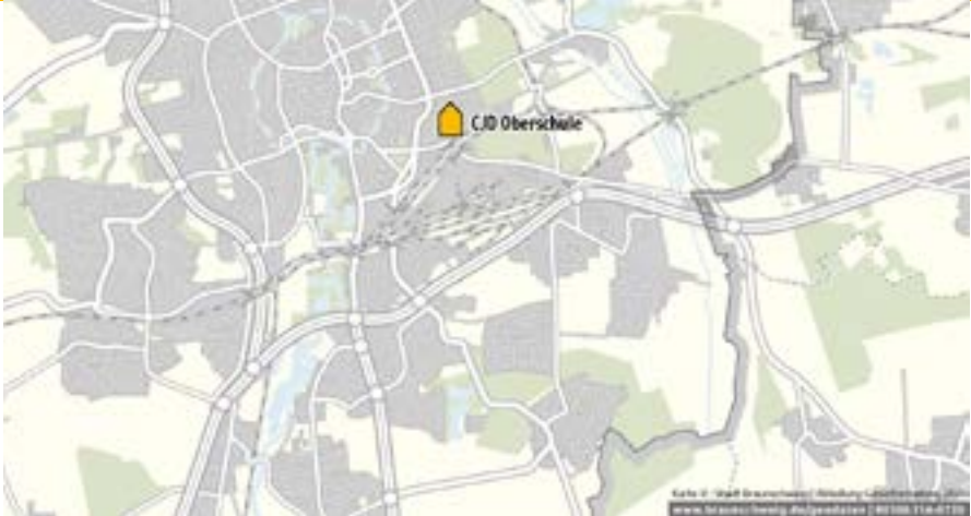
نمودار مدرسه اُبرشوله

مدرسه دوره اول متوسطه اُبرشوله کلاس های پنجم تا دهم را در خود دارد. این مدرسه ها می توانند برنامه های درسی هم سطح دوره اول متوسطه دبیرستانی را ارائه دهند و یا بدون برنامه های هم سطح دبیرستانی و به صورت عادی باشند. مدرسه اُبرشوله تمام وقت است و می تواند در بعد از ظهرها ساعت های فوق برنامه داشته باشد که شرکت دانش آموزان در آن ها دواطلبانه است، یا در بعد از ظهرها ساعت های فوق برنامه برای دانش آموزان سال تحصیلی ششم و هفتم و یا سه روز در هفته بعد از ظهرها ساعت های فوق برنامه اجباری برای همه ی دانش آموزان را ارائه دهد.