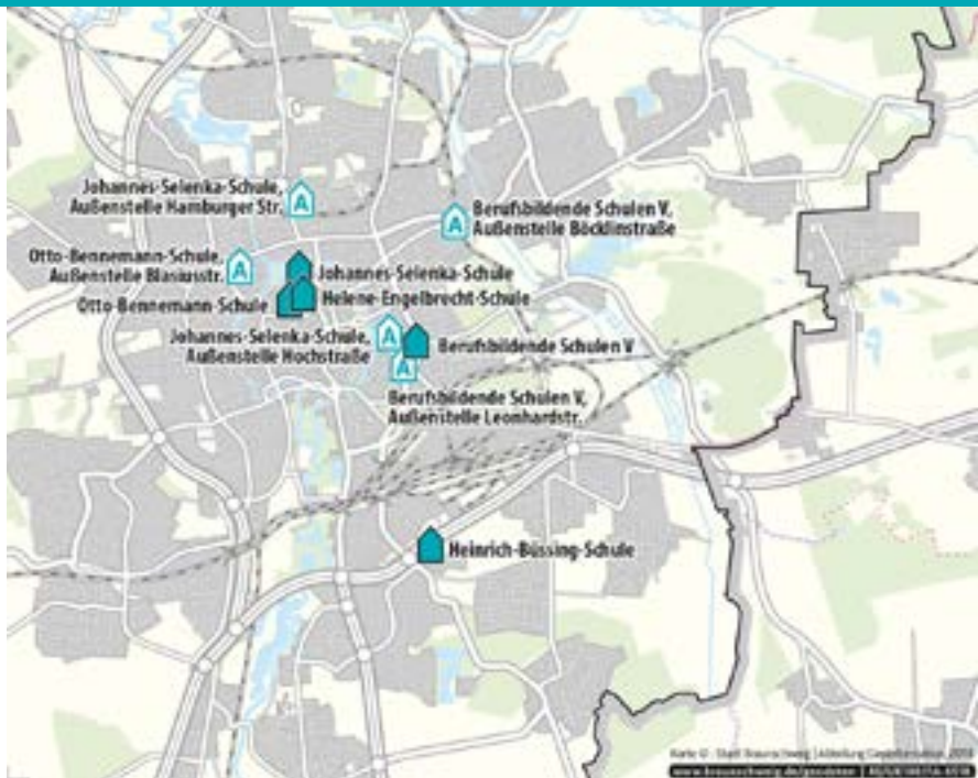
مورداری از مدرسه ها یا آموزشگاه های فنی - حرفه ای

آموزشگاه ها یا مدرسه های فنی - حرفه ای هم مراحل تحصیلی بالاتر را ارائه می دهند و به این وسیله امکان به دست آوردن پایان نامه های گوناگون تحصیلی را جدای از یک پایان نامه ی آموزش حرفه فراهم می کنند. در این بخش تنها دوره های تحصیلی معرفی می شوند که برای درس خواندن در این مرحله ها نیازی به پایان دوره یا مدرک آموزشی کار نیست و پایان یک دوره سطح بالاتر را امکان پذیر می کند.