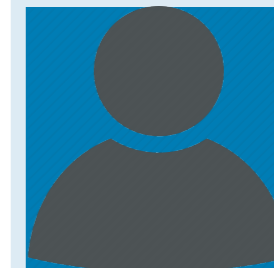
N.N. Telefon 470-3342 Zimmer 1.11