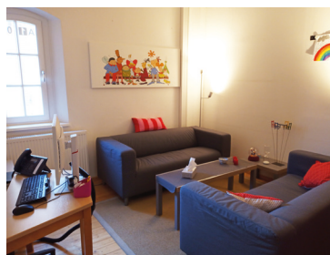
Beratungsraum Standort Echtenstraße

Mein Büro/ Beratungsraum teile ich mir mit dem Beratungsteam der Schule. Um ein Gesprächstermin zu vereinbaren, könnt ihr an meine Tür klopfen.