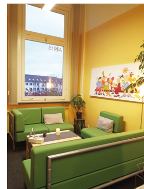
Beratungsraum Standort Breite Straße

Weitere Informationen sowie das „Rahmenkonzept Kommunale Schulsozialarbeit“ findenSie/findet ihr auf www.braunschweig.de/ schulsozialarbeit