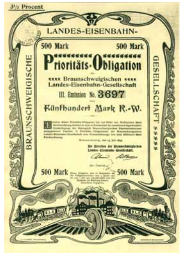
Aktie der Landes-Eisenbahn-Gesellschaft, Wert: 500 Mark Reichswährung

Im Südwesten des Bahnhofs entstand ein ausgedehntes Industriegebiet. Allerdings erwies sich die Lage des Bahnhofs im Süden der Stadt immer mehr als