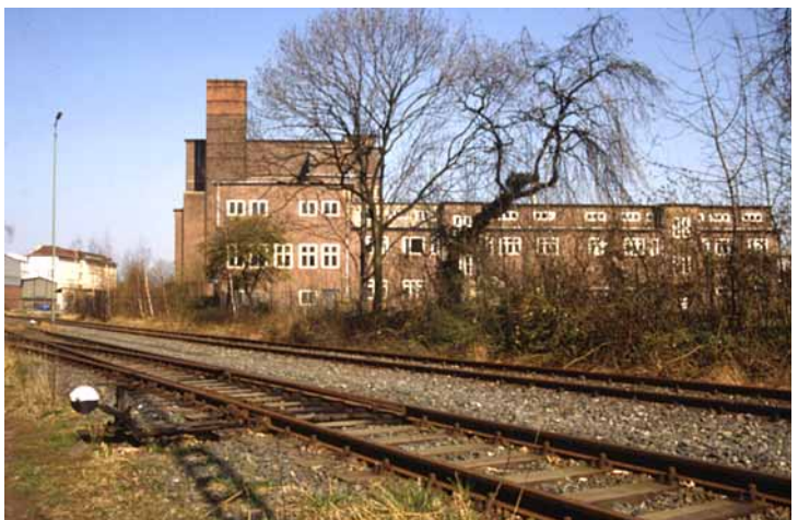
Westseite der ehem. Konsumbäckerei: ein kubisch angelegter Bau von 1930, ganz im Sinne des „Neuen Bauens“ der Bauhausarchitektur

Seit längerer Zeit bestehen seitens der Stadt Pläne, auf der ehemaligen Trasse einen Rad- und Fußweg anzulegen. Diese Zielstellung wird in einigen Bereichen bereits durch entsprechende Festsetzungen in zwischenzeitlich aufgestellten Bebauungsplänen gesichert. Damit ergeben sich günstige Perspektiven nicht nur für neue attraktive Wegeverbindungen, sondern auch für die an der Trasse liegenden historischen und erhaltungswürdigen Gebäude.