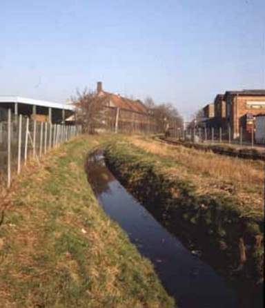
Südlich der Hildesheimer Straße parallel zum Ringgleis fließt die Schölke