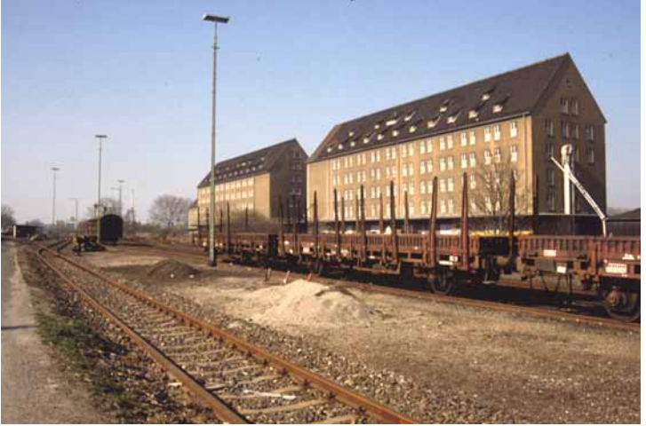
Lagerhäuser in Gliesmarode