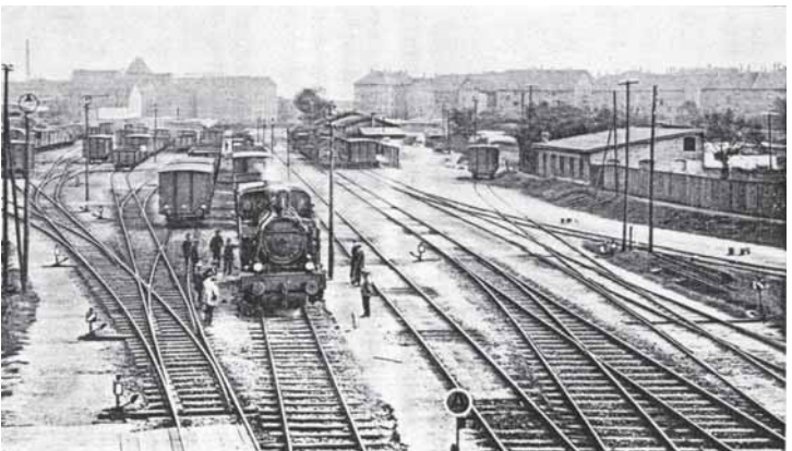
Westbahnhof: historische Aufnahme

Da Braunschweigs Interessen durch den neuen Besitzer der Bahn, - Preußen -, nicht genügend berücksichtigt wurden, gründete man 1884 die Braunschweigische Landes-Eisenbahngesellschaft (B.L.E.) . Ziel dieser Privatgesellschaft war es, durch den Bau von Nebenstrecken, sog. Sekundärbahnen, die