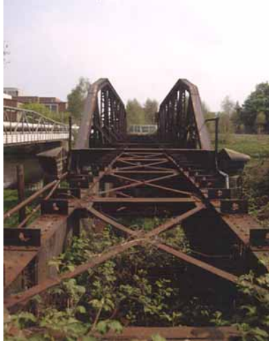
Okerbrücke in Richtung des heutigen Heizkraftwerkes

Die Industriegebiete hatten durch die Anlage der Ringbahn eine wesentliche Standortverbesserung erfahren und waren daher auch für Neuan-siedlungen attraktiver geworden. Um ansiedlungswilligen Betrieben erschlossenes Gelände bieten zu können, war neben der Trasse ein mehrere hundert Meter breiter Streifen freigehalten worden. Interessenten erhielten einen kostenlosen Gleisan-