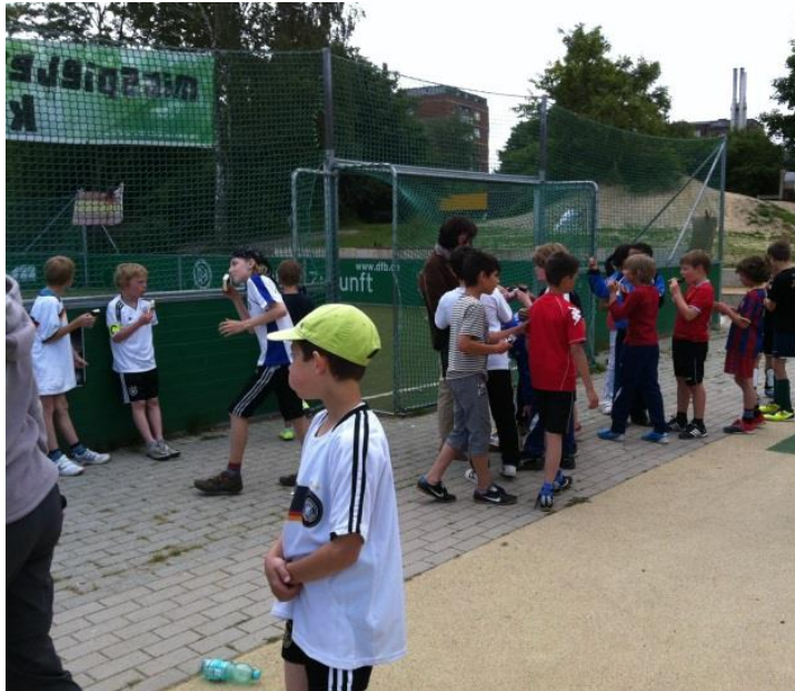
Stadteifeste und Veranstaltungen