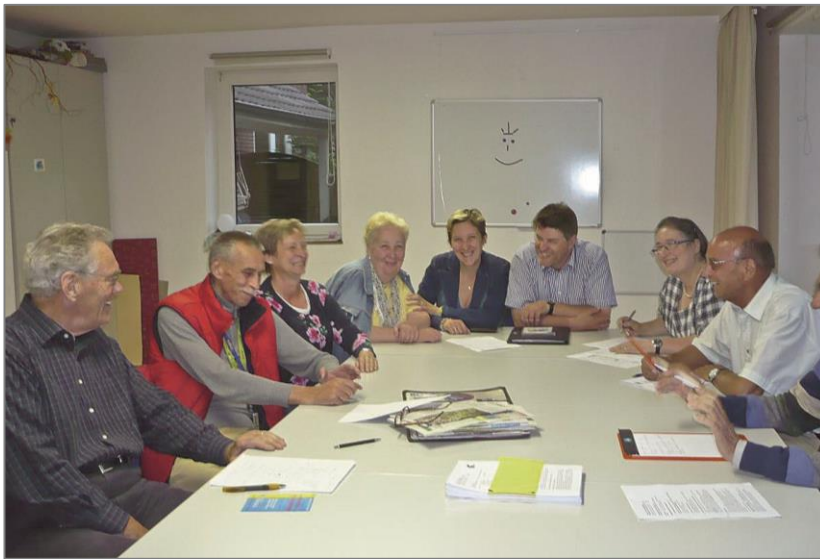
Gremien und Arbeitskreise

Wir unterstützen bei der Vernetzung unterschiedlicher Interessensgruppen und lokaler Akteure und bauen Kooperationsstrukturen auf.