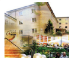
Fotocollage: Marc Ullmann und Peter Weichert

Ziel/Besonderheit: Reflektion eines Stadtteils, seiner Architektur, Fassaden, Farben und Oberflächen, die in Fotocollagen die urbane Identität der Weststadt festhalten