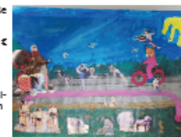
Ein Werk, das eine Schülerin im Rahmen des Wettbewerbs „Wie ich die Weststadt sehe“ erstellt hat.

Ziel/Besonderheit: Öffentlicher Kunstwettbewerb der Grundschule Altmühlstraße. Die 16 Besten wurden mit einer Urkunde und einem kleinen Geschenk prämiert.