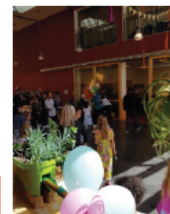
Sommerfest in der Grundschule Altmühlstraße

Ort: GS Altmühlstraße Zeitraum: Sommer 2018 Antragssumme: 300 €