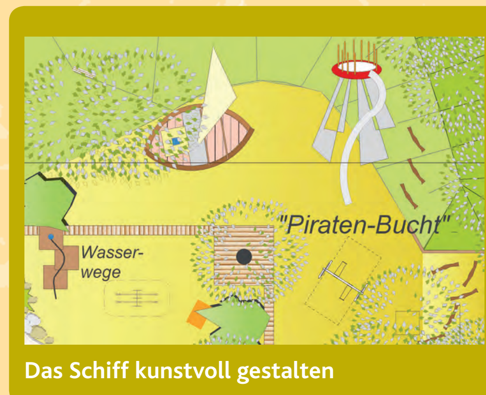
Das Schiff kunstvoll gestalten

Ein Projekt der Stadt Braunschweig in Zusammenarbeit mit den Bürgern vor Ort, dem Verein Stadtteilentwicklung Weststadt e.V., der Baugenossenschaft ›Wiederaufbau‹ eG und der Nibelungen-Wohnbau-GmbH gefördert mit Städtebauförderungsmitteln des Bundes und des Landes Niedersachsen.