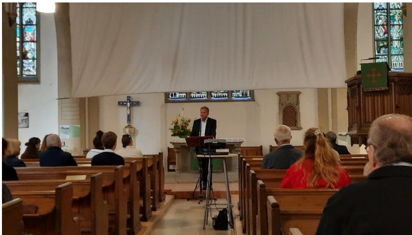
Grußwort von Oberbürgermeister Ulrich Markurth.

Die Stiftung ermöglicht jungen Menschen aus Braunschweig und der Region, im Rahmen eines Stipendiums einen Auslandsfreiwilligendienst in einer ihrer Partnerkirchen – beispielsweise in Frankreich, Indien, Japan, Bolivien, Tansania oder auch in Israel – anzutreten.