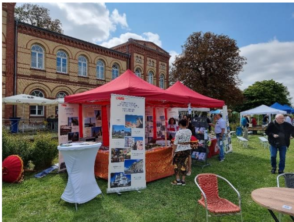
Die städtischen Zelte vor dem Haus der Kulturen.

Am 4. September fand im Haus der Kulturen ein Sommerfest statt, an dem sich viele internationale Vereine und Einrichtungen aus Braunschweig beteiligten. Zusammen mit der Deutsch-Indonesischen Gesellschaft Niedersachsen e. V. und der Vereinigung der Tunesier in Deutschland e. V. hat auch die Stelle „Internationale Beziehungen“ der Stadt Braunschweig an diesem Fest teilgenommen. Am gemeinsamen Stand konnten sich die Besucherinnen und Besucher über alle Partner- und Freundschaftsstädte Braunschweigs informieren, an einem Quiz teilnehmen und tunesische sowie indonesische Spezialitäten probieren.