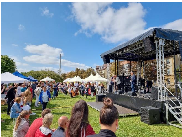
Oberbürgermeister Ulrich Markurth eröffnete das Sommerfest mit einem Grußwort.