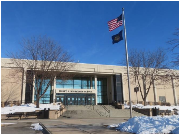
Harry A. Burke High School Omaha.

Leider gab es auch 2021 keine Möglichkeit für einen Austausch mit der Freundschaftsstadt Omaha. So konnten die Jugendbegegnungen des Fachbereichs Kinder, Jugend und Familie nicht stattfinden, die in enger Zusammenarbeit mit dem Braunschweiger Gymnasium Raabeschule und der Harry A. Burke High School in Omaha erfolgen. Ebenso entfiel der Schüleraustausch zwischen dem Gymnasium Hoffmann-von-Fallerleben-Schule und der Omaha North High Magnet School.