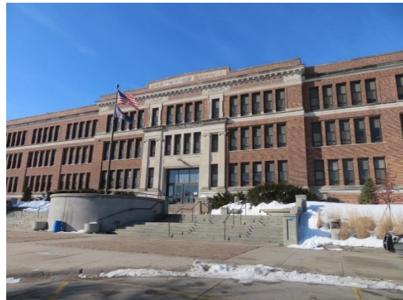
Omaha North High Magnet School.