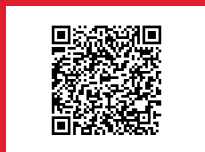
Mehr Infos gibts hier