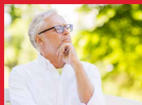
Denkathlon® TO GO