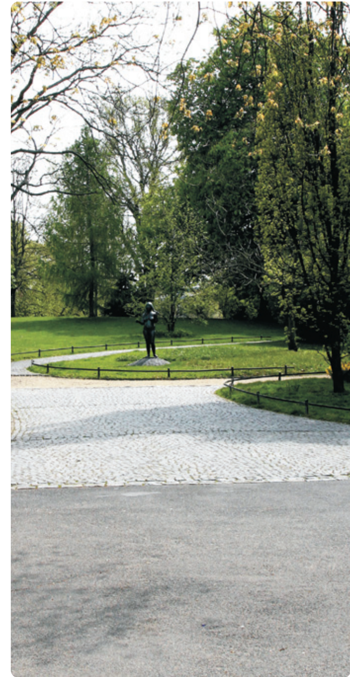
oben: Parkeingang am Theater links: Plan der Okerumflut 1840 (Staatsarchiv WF, K5167) (Ausschnitt heutiger Museumpark)