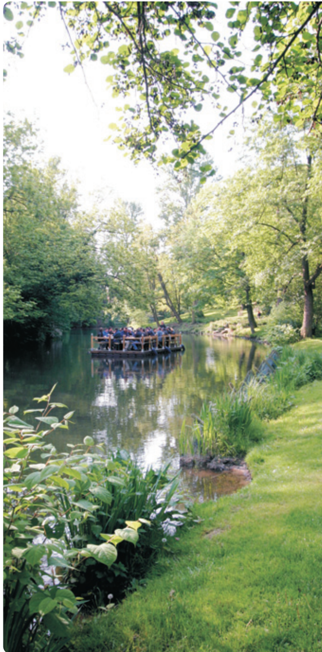
oben: Blick auf die Oker rechts: Blick in die Hauptachse vom Belvedereplatz

Literatur: Tute, Köhler: „Gartenkunst in Braunschweig, in Braunschweiger Werkstücke, Band 76 /1989“ Grahmann: „Vegetationsentwicklungskonzept Museumspark in Braunschweig“, 1994 Copyright und Herausgeber: Stadt Braunschweig, Fachbereich Stadtgrün und Sport, 2012 Internet: www.braunschweig.de/gruenanlagen