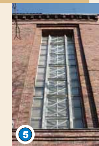
Fensterband der Treppenhäuser an den Kopfbauten der großen Hallen