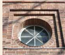
Fensterdetail an den Kopfbauten der großen Werkhallen