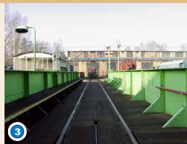
Schiebebühne: noch heute in Betrieb