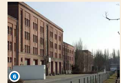
Die großen Werkhallen mit ihren Kopfbauten: im Vordergrund die ehem. Lok-Richthalle, hinten die ehem. Kesselschmiede