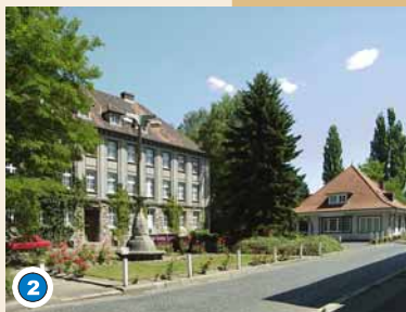
Vorplatz mit ehem. Verwaltungsgebäude und Pförtnerhaus