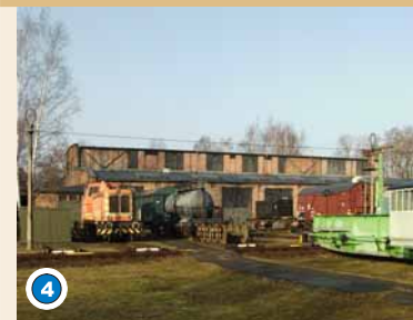
Ehem. Anheizschuppen mit davorgelagerter Schiebebühne