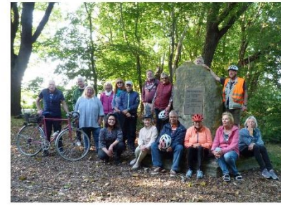
Das Stadtradeln-Team aus der Weststadt in der Nähe vom Ellernbruchsee.

Am Freitag, den 13. August 2021, hat das zweite Freiluftkino in der Weststadt stattgefunden. Da es sich dabei um eine der größeren Veranstaltungen handelte, die der Kulturpunkt West gemeinsam mit dem Quartiersmanagement „Soziale Stadt - Donauviertel“ durchgeführt hat, war an dem Tag eine positive Aufregung bei den Veranstaltern und Helfern zu spüren. Die ersten erwartungsvollen Gäste erschienen bereits eine Stunde vor Veranstaltungsbeginn und mussten sich noch ein wenig gedulden, während drinnen die letzten Vorbereitungen getroffen wurden..