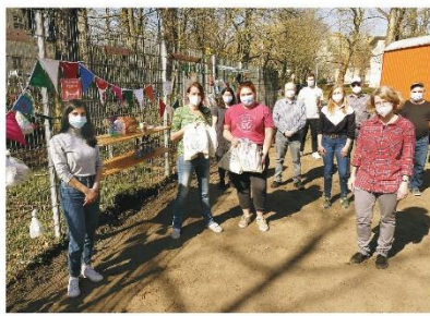
Die Kooperationspartnerinnen und -partner bei der Eröffnung des Gabenzauns im Frühjahr 2021.

Am 1. November 2021 sind Sie herzlich dazu eingeladen, sich auf dem Festplatzgelände in der Ludwig-Winter-Straße 4 eine warme Suppe abzuholen oder sie gemeinsam mit uns, dem Kulturpunkt West, dem Kinder- und Teenyklub „Weiße Rose“ und dem Quartiersmanagement „Soziale Stadt - Donauviertel“ zu genießen. Gleichzeitig bedeutet dies, dass ab dem 1. November 2021 keine Spenden mehr abgegeben werden können. Bei weiteren Fragen melden Sie sich gerne unter der Tel. 015773513446.