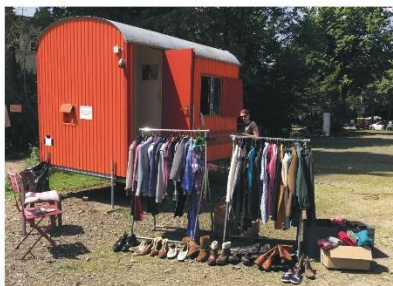
Die mobilen Kleiderstände haben dabei geholfen, die großzügigen Kleiderspenden zu sortieren.

Liebe Leserin, lieber Leser, das Jahr neigt sich wieder dem Ende zu, und im Donauviertel ist viel passiert. Neben unseren Veranstaltungen wie dem Campus-Café, dem Freiluftkino oder auch dem Sommerfest, gab es ein Projekt, das uns das Jahr hindurch begleitet hat: Der Gabenzaun! Wir erinnern uns zurück: Beim Gabenzaun handelt es sich um ein Projekt, das im Frühjahr 2020 durch den Kulturpunkt West, den Kinder- und Teenyklub „Weiße Rose“ und das Quartiersmanagement „Soziale Stadt - Donauviertel“ ins Leben gerufen worden ist. Er dient als Anlaufpunkt für Freiwillige, die dort Lebensmittel, Hygieneartikel und Kleiderspenden abgeben können, um so Bedürftigen in der Corona-Pandemie ein wenig unter die Arme zu greifen. Da uns im letzten Jahr sehr viele Spenden erreicht haben, wurde der Gabenzaun in diesem Jahr erweitert. Es sind weitere Bereiche entstanden für Tiernahrung und Spenden für Kinder, und auch das Pflanzenregal ist dazugekommen. Für die Unterstützung aller Beteiligten möchten wir uns sehr herzlich bedanken. Doch wie eingangs erwähnt, neigt sich das Jahr dem Ende zu, und es kommen vermehrt kalte und nasse Tage auf uns zu. Aus diesem Grund lösen wir den Gabenzaun auf und wollen dies mit einer warmen Suppe zum Mitnehmen tun.