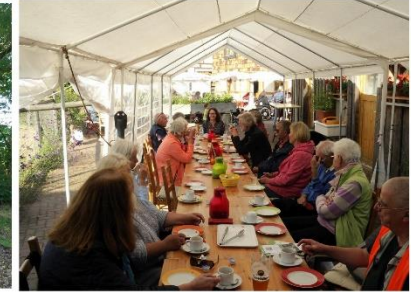
Eine Mittagspause im Dorfcafé Bleckenstedt.

Hier der Eindruck eines Teilnehmenden zur Auftakttour des Weststadt-Teams beim Stadtradeln: „Die Weststadt sattelt auf“ nennt sich das motivierte Team aus der Weststadt, das beim Braunschweig-weiten Stadtradeln, vom 5. - 25. September 2021, möglichst viele Kilometer auf dem Fahrrad sammeln möchte. Zur Auftakttour am Sonntag, den 5. September 2021, die vom Verein Stadtteilentwicklung Weststadt e.V., der Stadtteilaktivkasse und dem Quartiersmanagement „Soziale Stadt - Donauviertel“ organisiert worden ist, kommt eine stattliche Größe von 17 Radlern zusammen. Die Stimmung ist heiter, weil man sich an diesem warmen Sommertag auf das gemeinsame Radfahren freut. Bevor es losgeht, gibt Herr Bielefeld noch ein paar letzte Hinweise und verteilt das zweite Funkgerät für den Fall, dass sich die Gruppe aus den Augen verlieren sollte. Danach fährt man los. Da es sich bei der Größe des Teams offiziell um eine Kolonne handelt, müssen auch Autofahrer erstaunt anhalten, als es die Straße überquert. Violetta Lenz hat viel recherchiert über die Orte, die auf dem Weg liegen, und hat daher viele Hintergrundinformationen. Bei den Orten handelt es sich