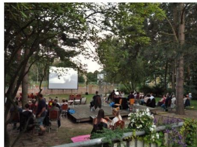
„Lola rennt“ im Garten des Kulturpunktes West.

Wir hatten uns viel vorgenommen für den Ernteaustauschmarkt am 10. September 2021. Ein buntes Programm aus Bastelaktionen, Kräutertouren und Tauschständen war zusammengestellt worden. Leider überraschte uns am Freitagmittag der Regen und der Tauschmarkt musste anders durchgeführt werden als geplant. Dennoch haben sich der Kulturpunkt West, der Kinder- und Teenyklub „Weiße Rose“ und das Quartiersmanagement „Soziale Stadt - Donauviertel“ sehr über die Teilnahme des Jugendumweltparkes gefreut, der ein Samenquiz vorbereitet hatte, und Most-Wanted, dem rollen Mostwerk mit dem lokalen Laufsafelt! Dank Kaffee, Kuchen und jeder Menge guten Laune gab es auch schöne Momente während dieses improvisierten Nachmittags.