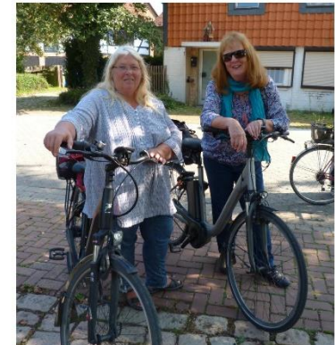
Gemeinsam macht das Fahrradfahren gleich noch viel mehr Spaß!

unter anderem um die ehemalige Wasch-Quelle in Gleitelde, die heutzutage hauptsächlich zur Erholung dient, die Schwedengräber, die an die Schlacht bei Thiede im 30-Jährigen Krieg erinnern oder den Ellernbruchsee, an dem man gerne eine Trinkpause einlegt. Da einige aus dem Team sich gut in der Umgebung auskennen, ergänzen sie die Informationen von Frau Lenz mit eigenen Anekdoten. Zur Mittagszeit findet man sich im Dorfcafé Bleckenstedt ein, einem restaurierten Fachwerkhause. Da es ein sonniger Tag ist, sitzt das Team auf der Terrasse, von wo es einen Blick auf das Tiergehege mit den Ponys und Hühnern werfen kann. Gleichzeitig werden Geschichten ausgetauscht und man gibt sich gegenseitig Tipps für erfolgreiche Radtouren. Da das Team aus sehr erfahrenen und wenig geübten Radfahrern besteht, hilft man sich gegenseitig, damit alle gut ans Ziel kommen. Dies stärkt auch das Gemeinschaftsgefühl, das an diesem Tag deutlich zu spüren ist.