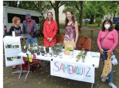
Der Jugendumweltpark hat für den Ernteaustauschmarkt ein Samenquiz vorbereitet.

Nach der Einlasskontrolle, es galt die 3G-Regel, freuten sich die Gäste darauf, es sich auf der Terrasse gemütlich zu machen. Unter ihnen fanden sich einige alte Bekannte, aber auch neue Gesichter, die zum ersten Mal den Campus Donauviertel sahen. Die Stimmung war ausgelassen und da es ein warmer Abend war, freute man sich auf die kühlen Getränke sowie auf Popcorn und Nachos, die der Kulturpunkt West bereitgestellt hatte. Bei dem Film „Lola rennt“ handelt es sich um einen Klassiker der deutschen Filmgeschichte, durch den man gemeinsam den Abend ausklingen ließ. Ohne den Verfügungsfonds, der Bewohner-Projekte aus dem Fördergebiet unterstützt, wäre dieser tolle Abend nicht zustande gekommen. Falls Sie auch die Idee für ein Projekt haben, dann kommen Sie gerne jederzeit auf das Quartiersmanagement zu.