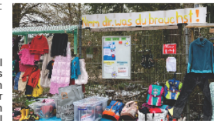
Eine Vielzahl an Kleiderspenden für Groß und Klein am Gabenzaun.

sind Sie alle herzlich eingeladen, auf dem Festplatzgelände in der Ludwig-Winter-Straße die verschiedenen Stände zu erkunden und bei verschiedenen Mitmachaktionen teilzunehmen. Sollten Sie kurzfristig noch Interesse daran haben, einen eigenen Stand anzumelden, sei es ein Infostand, eine Bastelaktion oder ein Stand für den Pflanzentausch, dann melden Sie sich gerne beim Kulturpunkt West. Tel.: 0531 8450 00 oder per Mail an: kpwb@braunschweig.de