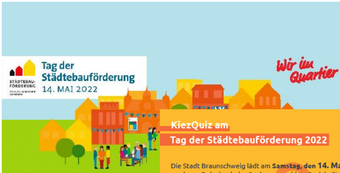
Bilder: Flyer Tag der Städtebauförderung