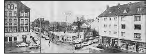
Frankfurter Platz_ BZ 1975 mit Nachkriegsbauten und Kluge