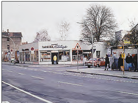
Nachkriegsbauten Tapeten Kluge Büttner