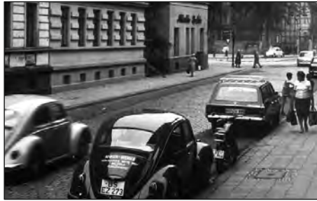
Blick Juliusstr. zur Kreuzung 60er Jahre Büttner

Für Ihre Fragen stehe ich wie bisher gerne zur Verfügung. Sie erreichen mich über meine Webseite unter www.Heiko-Krause.de , über Facebook oder telefonisch von Montag bis Donnerstag jeweils von 18 bis 19 Uhr unter der Rufnummer 0531-82398. Im Infoboard auf meiner Webseite finden Sie Bilder und Informationen zu