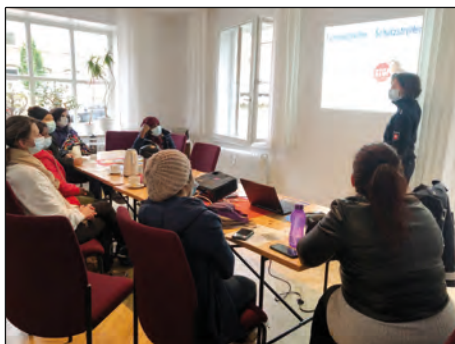
Ladies on Tour als aufmerksame Zuhörerinnen: Verkehrsunterricht bei den Radfahrerinnen von Morgen

Eine Querungshilfe im Einmündungsbereich der Hebbelstraße soll Fußgänger*innen den Übergang hier erleichtern. Einbiegende Fahrzeuge müssen in der Zukunft eine Nase umfahren. Insbesondere der Weg zwischen der Spielstube und dem Spielplatz auf der anderen Straßenseite wird dadurch sicherer. Die Maßnahme soll noch in diesem Jahr realisiert werden.