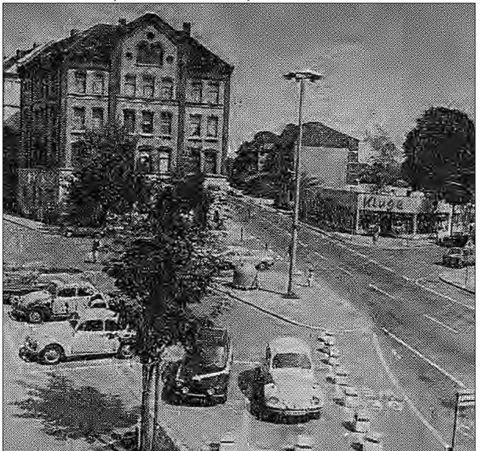
80er Durchfahrt Juliusstr. in Frankfurter Blockiert