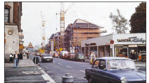
Foto 80er Neue Bauten Frankfurter

diversen Themen und auch einen Link zu älteren Ausgaben der Neuen Westpost, falls sie eine verpasst haben. Viel Spaß beim Stöbern.