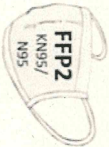
FFP2 KN95/ N95